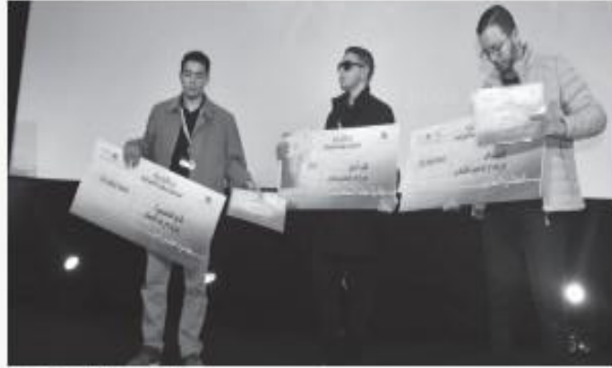
الدرجون بمسابقة الصورة الخضراء