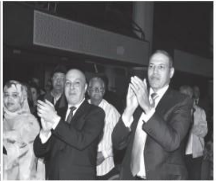
وإلى جهة مدير المركز السينمائي المغربي في تعامل مع استحضار أداء المنتخب المغربي في المونديال