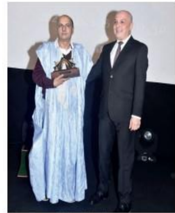
Hommage à Abdelouahab Sibawayh.