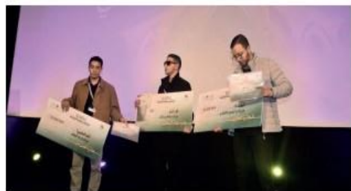
Les trois gagnants du concours de «la Marche Verte à travers les yeux des jeunes créateurs de l'image».